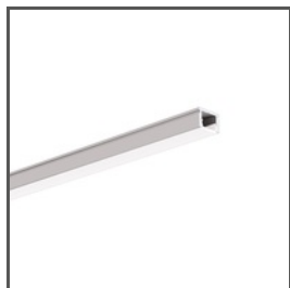
PIKO A08288 Ref. arch B8288