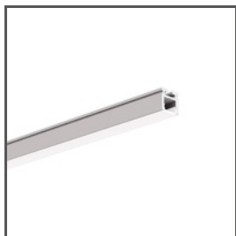
PIKO-ZM A01168 Ref. arch C1168