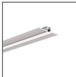
KOZEL-10 A01575 Ref. arch C1575