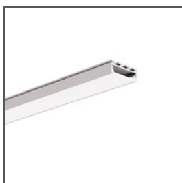
GIZA A05556 Ref. arch B5556