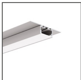
GIZA-LL-T A02479 Ref. arch C2479