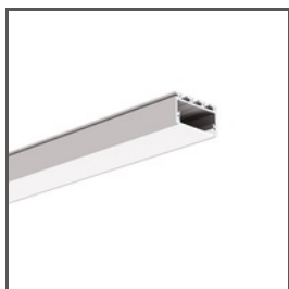
GIZA-LL A00758 Ref. arch C0758