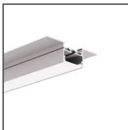
GIZA-LL-UST A02724N Ref. arch C2724