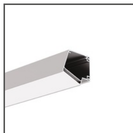
IMET A18012 Ref. arch 18012