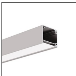
IKON A18013 Ref. arch 18013