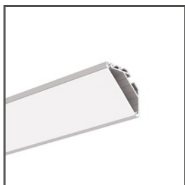
KOPRO A06367 Ref. arch B6367