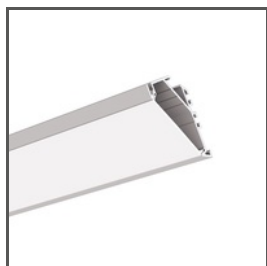
KOPRO-30 A07890 Ref. arch B7890