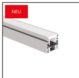
HR-OPTI A01844+C28090N00 Ref. arch C1844+42121