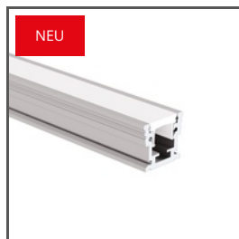
HR-MAX A01829+A01827+A01828 Ref. arch C1829+C1827+C1828