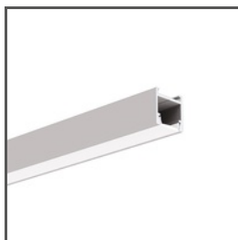
PDS-H A0920 Ref. arch B9204