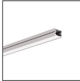
TAPO A01919 Ref. arch C1919