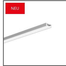
MICRO-PLUS A02966 Ref. arch C2966