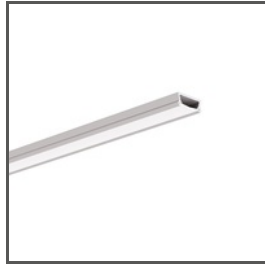
TAMI A05390 Ref. arch B5390