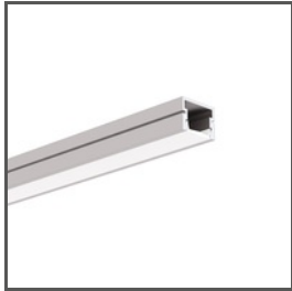
PDS-4-PLUS A01263 Ref. arch C1263