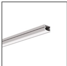
TAPO A01919 Ref. arch C1919