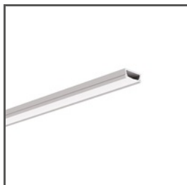
TAMI A05390 Ref. arch B5390