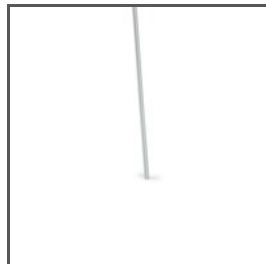
STAB FI-3-ALU C28196A01, C28196A07 Ref. arch 42526, 42527, 42528, 42529