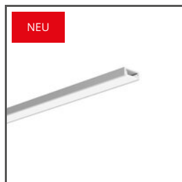
MICRO-PLUS A02966 Ref. arch C2966