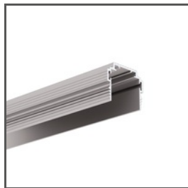
TEKNIK-ZM-TK A01554 Ref. arch C1554