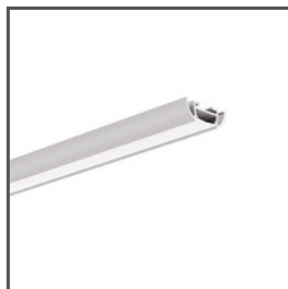
TOST A05393 Ref. arch B5393