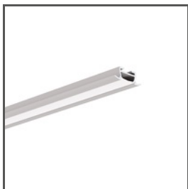
TAKO A05392 Ref. arch B5392